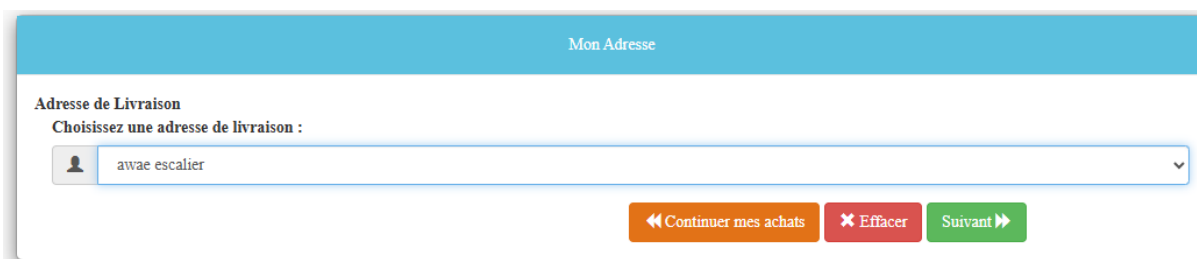
Figure 9 : Formulaire de localisation pour passer une commande 2.

Choisissez par la suite le moyen de paiement souhaitez et validez.