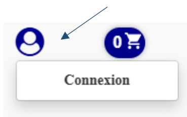
Figure 2 : Icône de connexion